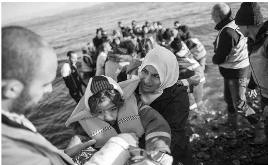
Die EU setzt Griechenland massiv unter Druck, damit sie Flüchtlinge an der Seegrenze abwehrt. Griechenlands Regierung fragt, ob die EU-Länder der Auffassung seien, dass die Flüchtlinge ertrinken sollten. „Was wollen Sie, dass wir tun?“

ist Abschreckung, Abwehr, Abschottung und Abschiebung. Zwar redet die Kanzlerin noch von offenen Grenzen, lässt aber ihren Innenminister alles dicht machen. Und nun wird auch noch die NATO erstmals in der Geschichte des Militärbündnisses auf Betreiben Deutschlands, der Türkei und Griechenlands zur Bekämpfung von Flüchtlingsbewegungen nach Europa eingesetzt.