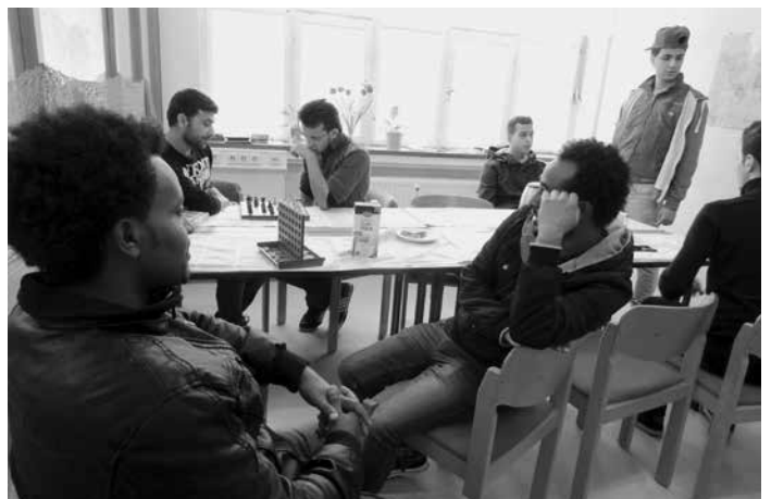
Spielen und entspannen im Asylcafé.

Mir bleibt an manchen Tagen nur, mit dermaßen bedrückten Menschen einen Gang durch die Natur zu machen, zuzuhören, offen zu bleiben, sie wahrzunehmen, dauerhaftes Willkommensein zu zeigen. ☘