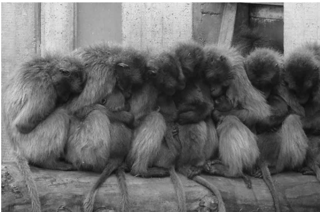
Gemeinschaft gibt Wärme!

Lebenshaus Schwäbische Alb – Gemeinschaft für soziale Gerechtigkeit, Frieden und Ökologie e.V. ist Gründungsmitglied der Allianz „Rechtssicherheit für politische Willensbildung“. ☘