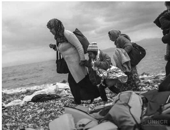
Aus Verzweiflung über das Fehlen von legalen und sicheren Fluchtwegen kommen immer mehr Frauen und Kinder über den Seeweg nach Europa - ein lebensgefährliches Unterfangen.

Rund 58.600 Schutzsuchende erreichten UNHCR zufolge im Januar die griechischen Küsten. Mehr als die Hälfte von ihnen sind mittlerweile Frauen und Kinder - PRO ASYL hatte bereits im Dezember davor gewarnt, dass dies eine Folge der Einschränkung des Familiennachzugs sein wird. Unvermindert kommt es bei der gefährlichen Flucht über das Mittelmeer zu Todesfällen: