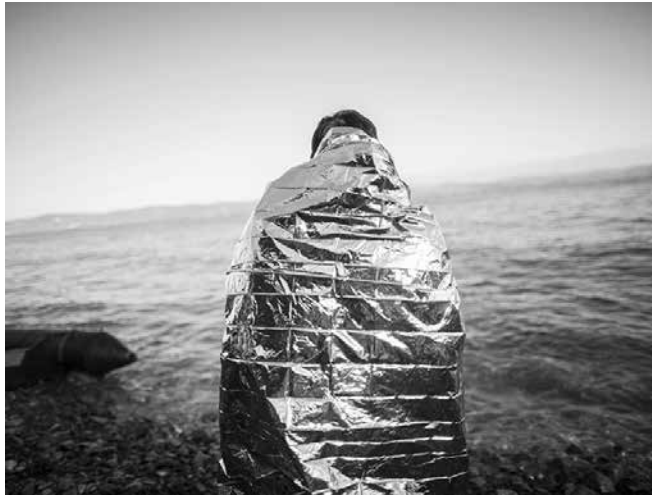
Ein Überlebender auf Lesbos blickt auf die Ägäis, in der allein im Januar 2016 über 200 Flüchtlinge auf der Flucht nach Europa starben.

Doch damit nicht genug. Auch den nicht-staatlichen Rettungsorganisationen, die in der Ägäis im Einsatz sind, wird die Arbeit immer weiter erschwert: Künftig dürften zivilgesellschaftliche Organisationen nicht mehr in den Gewässern vor den griechischen Küsten „patrouillieren“, heißt es in einer schriftlichen Anweisung der griechischen Küstenwache vom Januar. Die Begründung: Der Einsatz der HelferInnen könne