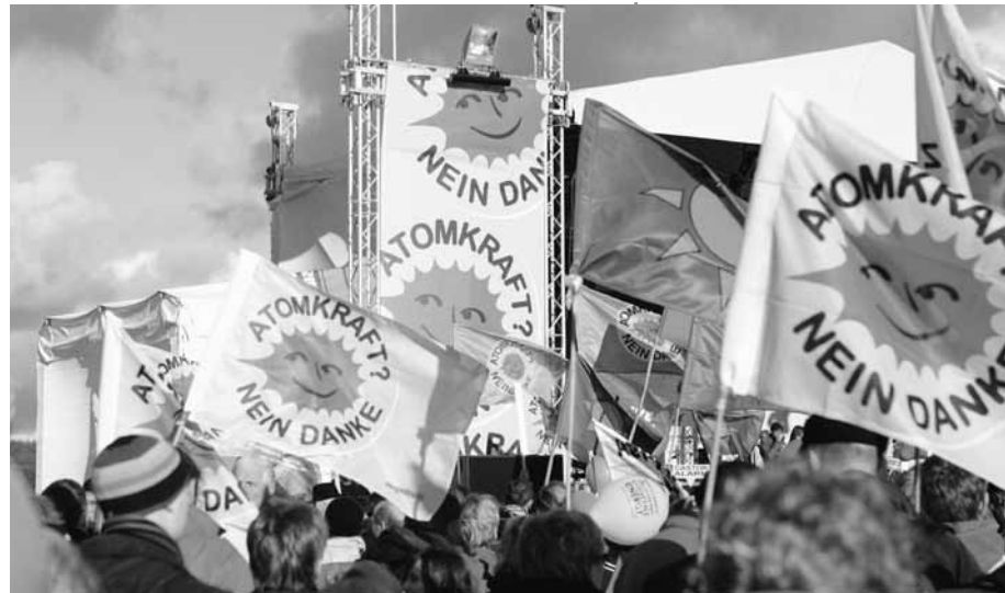
Wer Protestpolitik als urdemokratische Form der Einmischung in die eigenen Angelegenheiten begreift, kann sich über die massenhaften Proteste gegen Stuttgart 21 oder den Castor-Transport nur freuen.

Nicht vergessen werden darf allerdings, dass diese Schlichtungsgespräche überhaupt erst angesichts des unübersehbaren, kreativen, anschwellenden Protests zehntausender Bürgerinnen und Bürger möglich wurden. Der brutale Polizeieinsatz mit Wasserwerfern, Tränengas und Knüppeln am „schwarzen Donnerstag“ Ende September mit hunderten von verletzten Demonstranten hat eine riesengroße