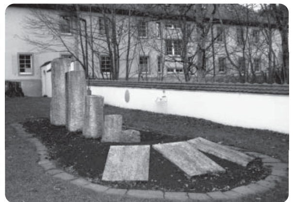
Gedenkstätte, die als Mahnung und Erinnerung an 61 Menschen aus den Mariaberger Heimen in Gammertingen errichtet wurde, die 1940 Opfer der Euthanasie durch die Nazidiktatur wurden.